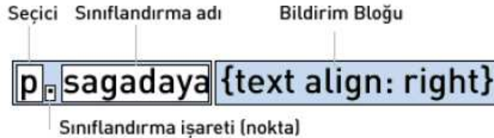
Şekil3.1 Sınıf seçicilerin yapısı

Aynı HTML elemanına farklı özellikler atamak için Sınıf Seçicisini kullanırız.